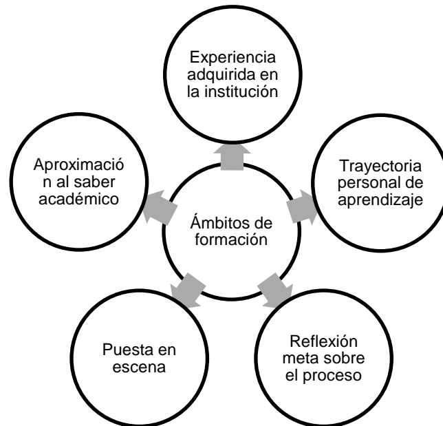
Figura 1. Ámbitos de formación del profesorado

Aproximarse a los fenómenos humanos con la voluntad de comprenderlos y de interpretarlos exige dar la voz a los participantes para que generen un discurso sobre lo qué piensan, sobre lo qué dicen que hacen y sobre lo qué hacen (Bruner, 1990). Ahora bien, cuando nos referimos al pensamiento debemos precisar que no es posible separar el aspecto intelectual de nuestra consciencia del aspecto afectivo, volitivo. Intelecto y afecto están entrelazados hasta tal punto que si se conciben de manera aislada se da al proceso del pensamiento “la apariencia de un flujo autónomo de pensamientos que se piensan a sí mismos, apartado de la amplitud de la vida, de las necesidades y los intereses personales, las inclinaciones y los impulsos del que piensa” (Vigotsky, 1978, p. 76).