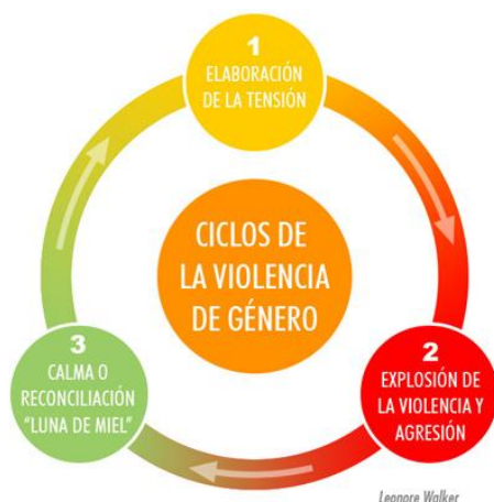
Figura 2: Cicle de la violència per fases

Aquest cicle no té un procés temporal definit, en cada relació una fase pot durar més o menys temps, depenent de cada cas particular, però les etapes es fan cada cop més curtes quan el cicle torna a començar. La figura masculina és qui controla la temporalitat de la fase de lluna de mel, i la dona es comença a adonar que no pot controlar el comportament de l'home i se centra en mantenir-se amb vida dins la relació per no implicar als fills/es. En totes les fases l'home intenta minimitzar la situació de violència i culpa a la dona d'exagerar la situació. Tanmateix, cal remarcar que el cicle contempla la violència física, psicològica i sexual, però no inclou la violència econòmica.