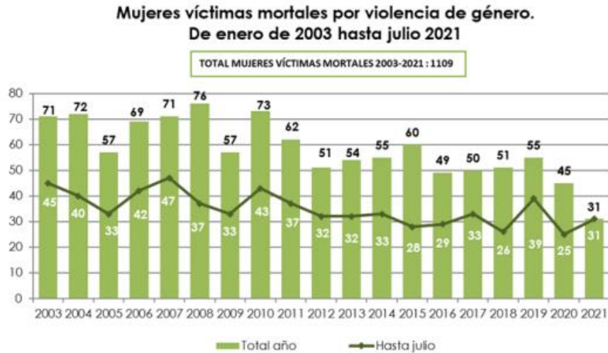
Figura 1: Gràfic de dones víctimes mortals de violència de gènere (2003-2021) / Font: Ministeri d'Igualtat. Delegació del Govern contra la Violència de Gènere

A continuació i després de descriure conceptualment la violència i la violència de gènere així com quantificar-ne les dades, presento un seguit de tipologies entorn la violència de gènere, les quals, avui en dia encara es troben presents.