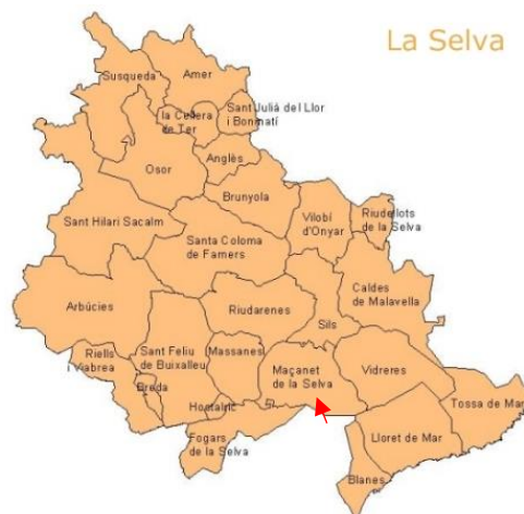
Figura 2. Mapa poblacions de la comarca de la Selva. Font: Gencat ( 2022)

L'Escola les Arrels es troba a Maçanet de la Selva, un municipi de la comarca de la Selva, però situat al límit del Maresme. Aquest poble limita amb "els termes municipals de Sils i Riudarenes al nord; Massanes a l'oest i Fogars de Tordera, Tordera i Lloret de mar al sud, mentre que Vidreres és a l'est" (Ajuntament de Maçanet de la Selva, 2021). Maçanet té una superfície de 45,58 km 2 i una població de 7.349 habitants ( IDESCAT, 2021), que es distribueix pel seu nucli urbà i els vuit veïnats que formen el poble. El 50% dels habitants estan dispersats per les diferents urbanitzacions i això provoca que un terç "de la població escolar depengui del desplaçament motoritzat per anar a l'escola" (Escola Nova de Maçanet de la Selva, 2016) a causa de la distància en vers el seu lloc de residència.