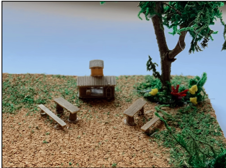
Recurs 5: Fotografia ampliada de la zona de joc simbòlic