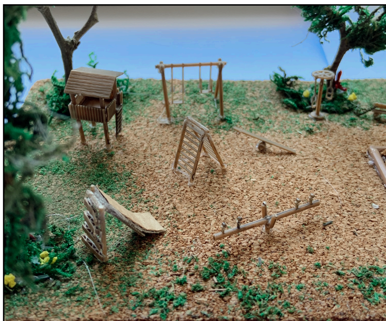
Recurs 3: Fotografia ampliada de la zona de pati de jocs