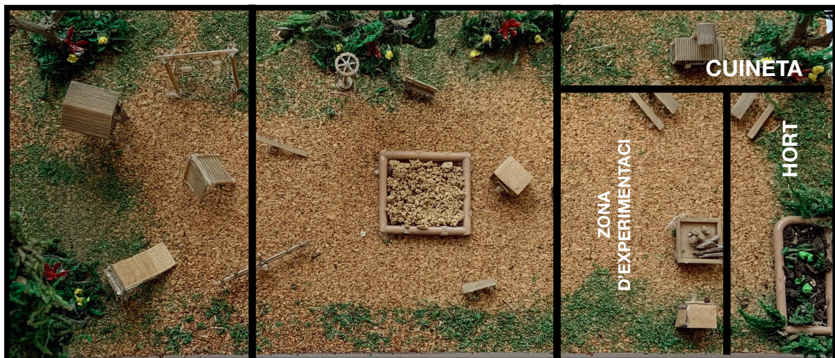
Recurs 2: Fotografia de la maqueta des d'adult

Tal com explica el Departament d'Ensenyament (2016), s'ha de planificar l'espai del pati per fer-ne un espai que potenciï l'assoliment de les capacitats dels infants, per tant, ha d'ofrir zones que puguin aportar experiències i coneixements diferents dels nens i nenes. Així doncs, el model de maqueta realitzat volia que tingués zones diferenciades per treballar o oferir aprenentatges diversos als infants, col·locant les següents zones: