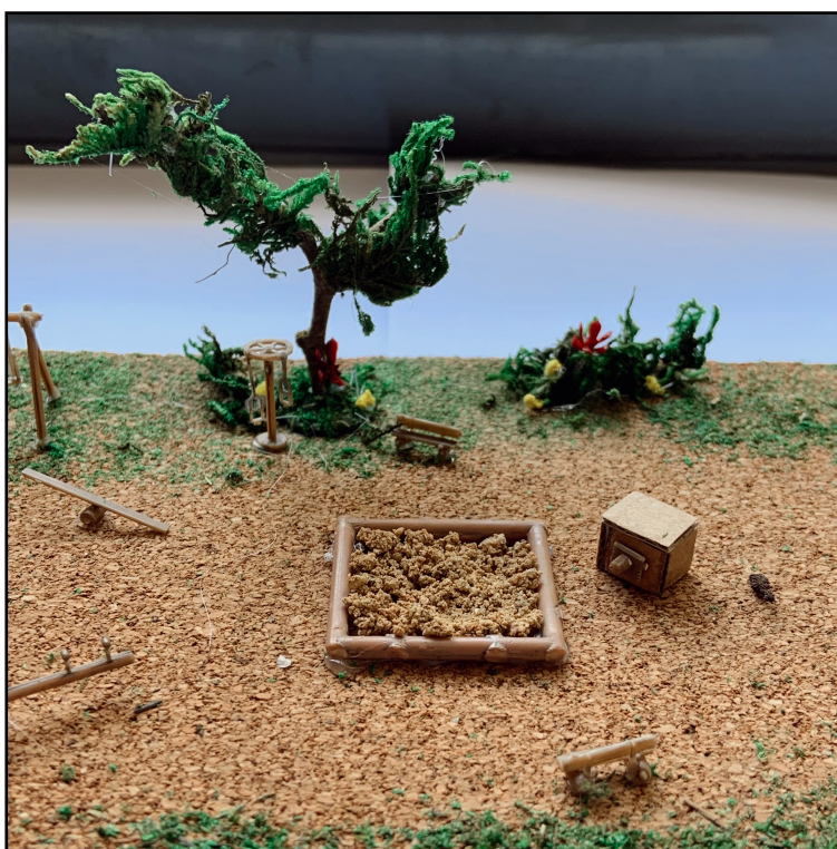
Recurs 4: Fotografia ampliada de la zona de sorral