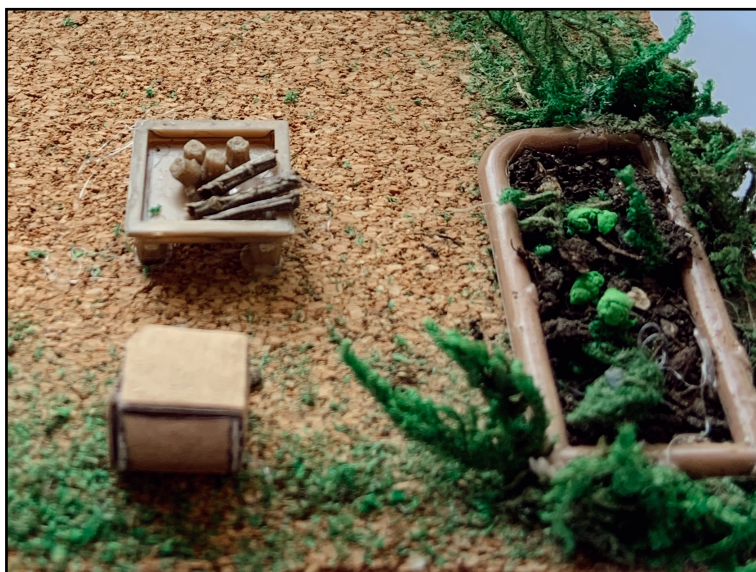
Recurs 6: Fotografia ampliada de la zona d'experimentació i hort