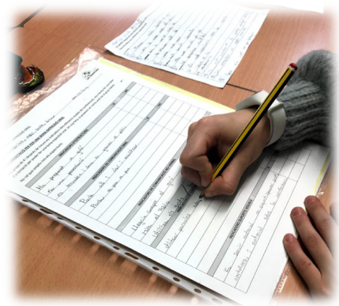
Alumne escrivint la base d'orientació.

A partir d'aquests indicadors, tals com: to de veu, fluïdesa, gesticulació, mirada, posició corporal, suports visuals...el Grup Impulsor va crear 5 ítems generals (Indicadors d'estructura, indicadors de comunicació oral, indicadors de comunicació no verbal, indicadors de continguts i indicadors de suport visual) perquè els alumnes poguessin omplir, en grups de 4, la graella de la base d'orientació amb tots els indicadors que van poder extreure de les visualitzacions de models d'expressió oral. Al final, amb tot el grup classe es va unificar un sol model de base d'orientació.