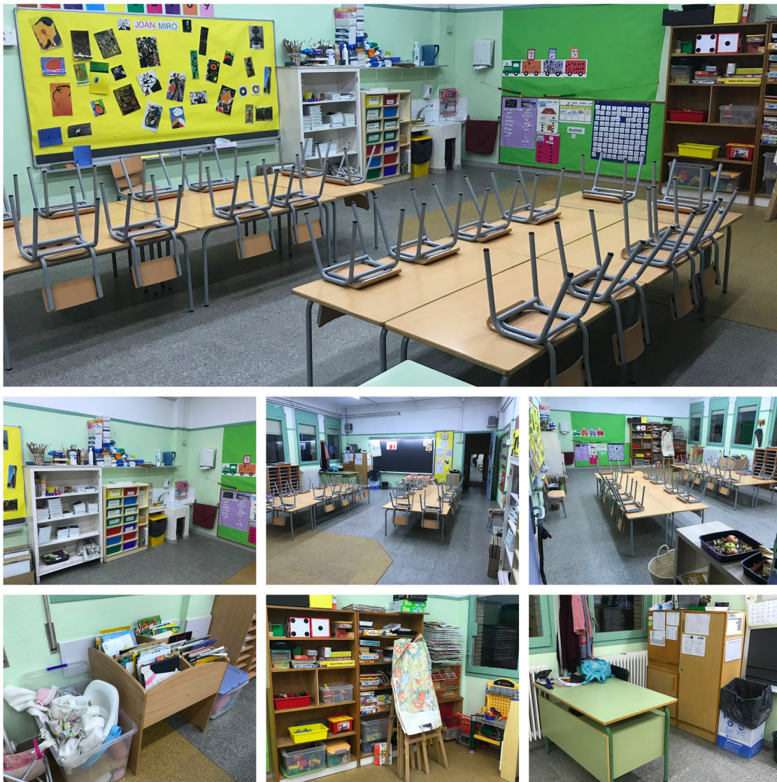
IMATGE 1: aula de P4 abans de la millora

Tenint en compte aquests objectius, vam crear una graella d'observació que, posteriorment també ens ha de servir per valorar el nou espai creat. En aquesta graella es valorava l'espai en interacció amb els alumnes, tenint en compte els criteris següents: autonomia, benestar i estètica, comunicació i socialització, circulació i moviment i material. Intentant crear ítems observables i quantificables per tal que la valoració de l'espai pogués ser el màxim d'objectiva possible.