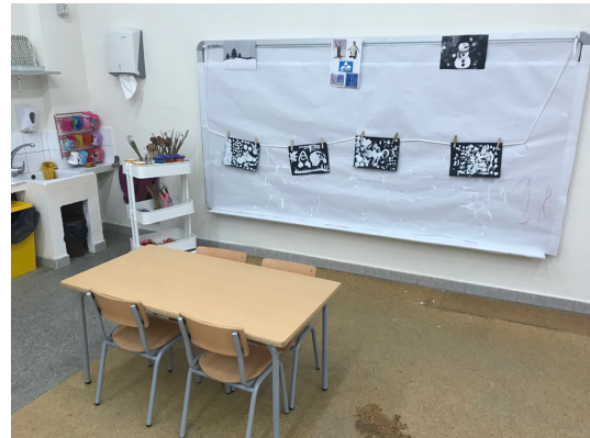
IMATGE 3: Nova aula de P4

El primer dia de posada en marxa el nou espai tots estan emocionats i contents, tant els alumnes, com les famílies i la mestra. I diferents comentaris positius van sorgint, que la mestra va captant, sobretot per part de les famílies: sembla més gran i lluminós, que ben endreçat i organitzat tot, en un espai així també hi treballaria jo, que agradable,... per part dels infants ho volen investigar tot i van mirant tots els racons de la nova aula, alguns comenten que hi falten joguines i d'altres s'adonen que n'han tret però que també n'hi ha de noves. Els agrada molt el racó de lectura i els bancs, de seguida hi van a seure i a mirar nous contes.