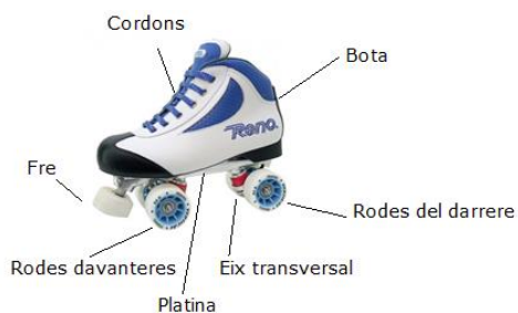
Figura 7. Bota d'hoquei sobre patins de la marca Reno.

Els jugadors per practicar/jugar l'hoquei sobre patins, tal com ho diu el nom de la mateixa modalitat esportiva ho fan calçant unes botes especials amb patins de quatre rodes, les quals han de rodar lliurement essent posades paral·lelament de dos en dos amb dos eixos transversals, subjectats amb una platina que va enganxada amb la bota. Al capdavant d'aquesta platina trobem un fre davanter anomenat amb terminologia tècnica de l'esport "taco", és l'objecte que ajuda al jugador a arrencar amb inèrcia el seu patinatge. Figura 4.