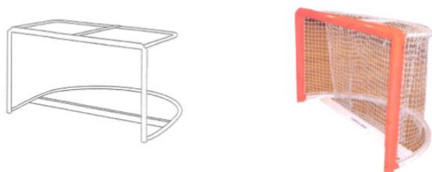
Figura 4. Imatge de la porteria oficial per la RFEP d'hoquei sobre patins.

Les mides de la porteria d'altura són 1,05 metres i d'amplada 1,7 metres.