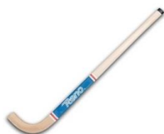
Figura 5. Estic d'hoquei patins

Instrument d'una llargada de 90-115 cm aproximadament, constituït al 100% de material de fusta i amb un pes d'entre 450-500 grams. Té la característica de tenir dues cares simètriques de caràcter llis i pla. Té una peculiaritat, ja que no és un objecte de fusta totalment allargat sinó que destaca pel seu acabament amb forma de corba amb les dues cares llises i planes com tota la resta del cos d'aquest que permet la conducció d'un altre instrument propi de l'esport que veurem més endavant com és la pilota. No tots són de fusta, sinó que també existeixen de fibra de carbó però la gran majoria utilitza els de fusta.