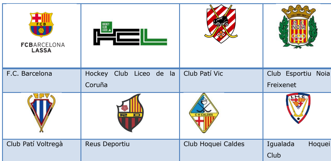
Taula 3. Equips participants a la competició de la Copa del Rei 2016.

Els equips classificats a la convocatòria de la respectiva competició: