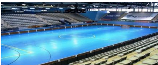
Figura 2. Imatge d'un pavelló esportiu oficial on es practica l'hoquei sobre patins

L'hoquei sobre patins es juga en una pista tancada, rectangular, de superfície plana i de caràcter llis. Segons el reglament tècnic de la RFEP (2009), la pista està tancada pels quatre costats que formen la figura rectangular mitjançant un conjunt de balles, amb una altura d'aproximadament 1-1,5 metres. El terreny de joc està constituït per dimensions que oscil·len entre una longitud màxima de 44 m i una mínima de 34 m i una amplada d'entre 22 m i 17 m. Majoritàriament els diversos terrenys de joc tenen una longitud de 40 m i una amplada de 20 m. Aquest terreny de joc o pista està delimitat per les seves respectives línies de joc i les dues porteries, una per cada mitja pista. Com podem veure a la figura 1 un pavelló esportiu oficial on es practica hoquei sobre patins (Blanes).