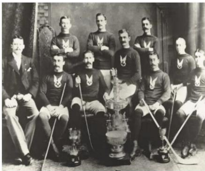
Figura 1. Imatge de l'Amateur Hockey Association.

Segons l'article de Gallén (1991), que resumeix l'evolució històrica de l'hoquei sobre patins, sabem que l'inici de l'hoquei sobre patins té lloc a finals del segle XIX a Anglaterra, per l'anomenat Edward Crawford. Aquest va portar la idea de practicar un nou esport, el "rink hockey". Es tractava d'una adaptació del popular esport nord-americà de l'hoquei sobre gel.