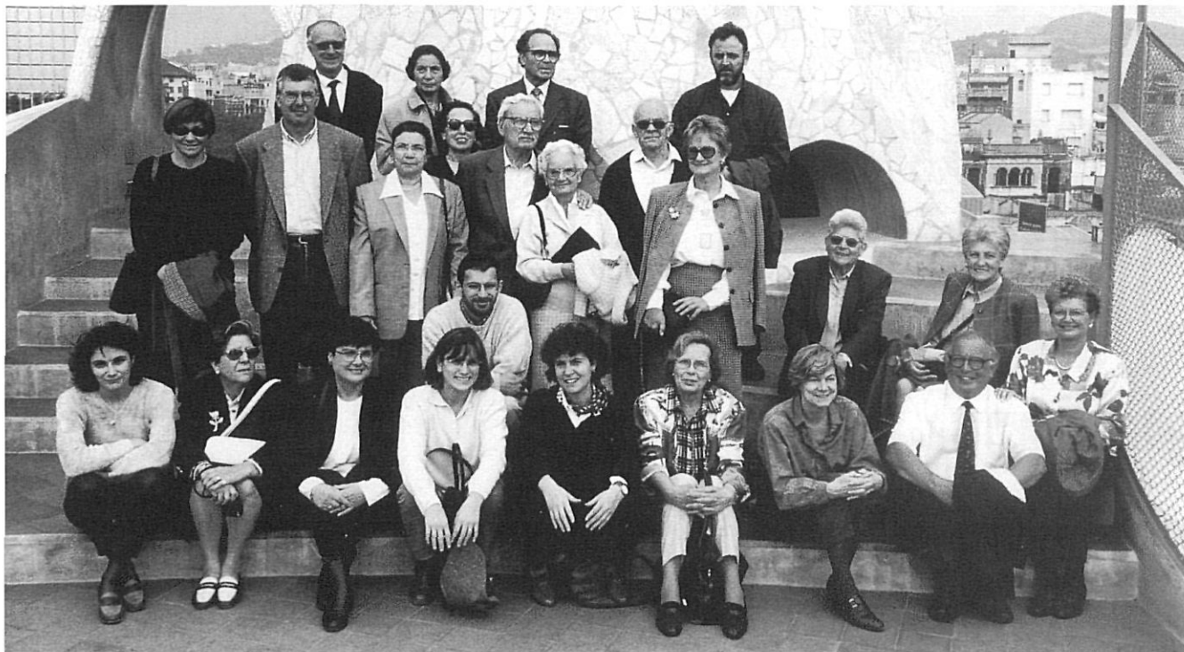
Centre Estudis Comarcals Banyoles. Visita a la Pedrera, Barcelona, 1996.

dis i cada un respon a unes necessitats particulars. El contacte entre ells ha estat permanent des de sempre: per exemple, els intercanvis de publicacions són una pràctica molt estesa, però totalment insuficient. Fa falta organitzar activitats comunes i impulsar debats generals que consolidin els centres d'estudis. Com a fruit d'aquesta col·laboració s'enfortiran i s'aprofundirà en la qualitat i abast de les seves aportacions culturals i científiques.