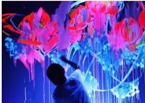
Que Huoxo artista de carrer Japonès- Pintura Fluorescent

Per portar a terme l'activitat s'ha triat l'autor: