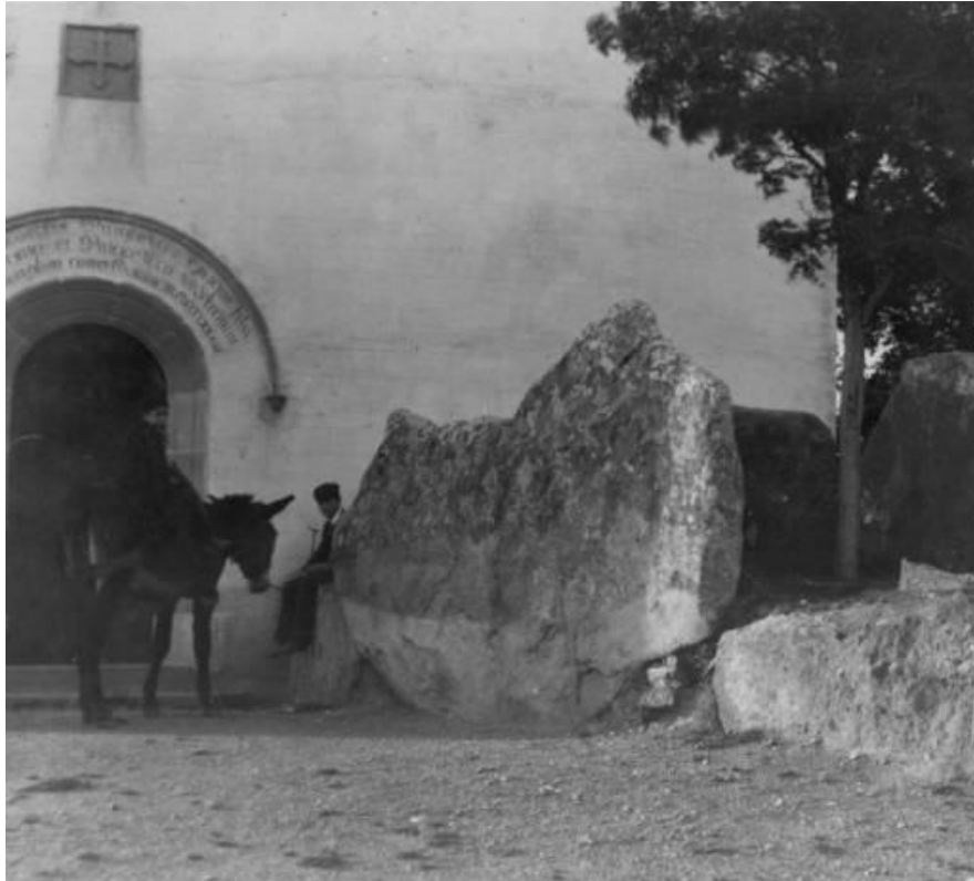
Figura 4. En aquesta fotografia es pot apreciar com a principis del segle XX hi havia un arbre dins l’espai que queda entre les lloses gegants. Extret de "Dos homes amb un ase davant el dolmen Puigseslloses a Folgueroles". Consultat des de http://mdc.cbuc.cat/utills/ajaxhelper/?CISOROOT=afcecemc&CISOPTR=3009&action=2&DMSCALE=40&DMWIDTH=409&DMHEIGHT=284&DMX=0&DMY=0&DMTEXT=&DMROTATE=0 . Memòria Digital de Catalunya . Copyright, Arxiu Fotogràfic Centre Excursionista de Catalunya.

Citació en el text del treball: “...en una fotografia anònima de principis de segle es veu com l’arbre havia crescut al mig de les pedres del dolmen (vegeu figura 4).”