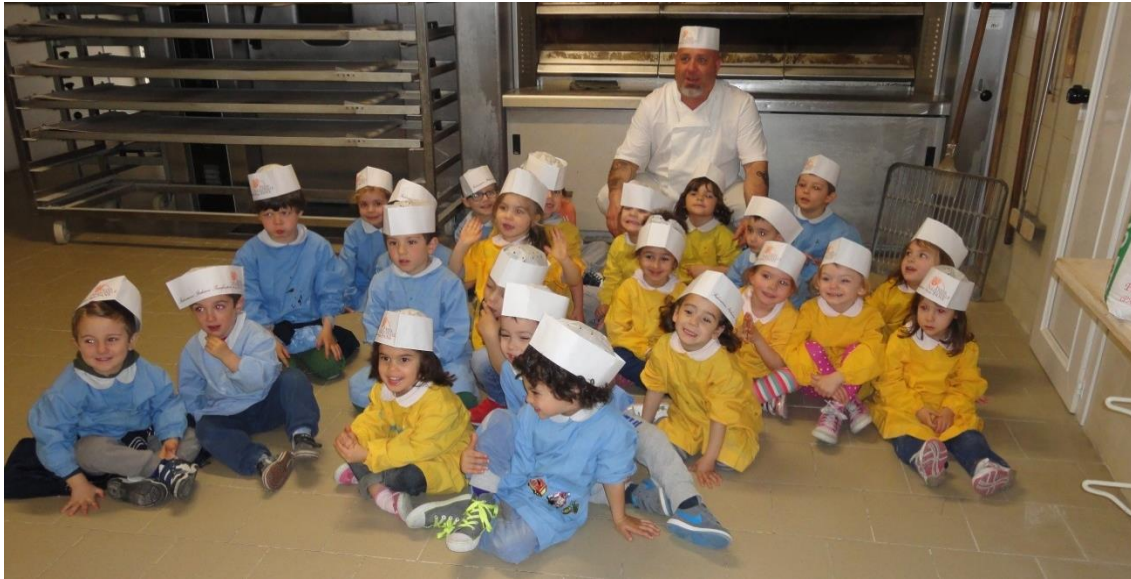
Foto del grup-classe durant una visita al forner del poble.