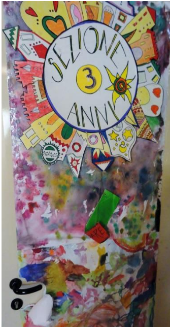
La porta de la classe de 3 any, decorada pels propis infants