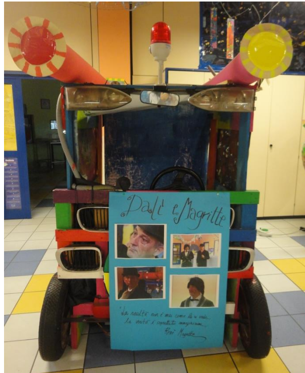
Una fotografia de la màquina del temps

Els altres instruments que utilitzen per posar en pràctica la filosofia són les diferents activitats, jocs i excursions que es desenvolupen el llarg del curs. Totes aquestes accions tenen en compte els principis bàsics que comenta Nicola Cuomo; es treballa les emocions, les ganes de conèixer, el valors socials, etc.