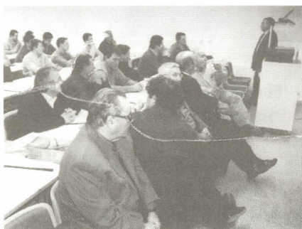
Aspecte d'una jornada organitzada per la UV.

El proper mes de maig la Facultat de Ciències Jurídiques i Econòmiques de la Universitat de Vic organitza unes Jornades sobre l'Empresa Familiar. Aquestes jornades estan adreçades als empresaris vinculats a empreses familiars, assessors d'empresa i directius empresarials i estudiants i professionals de l'àmbit del dret i de l'economia especia-