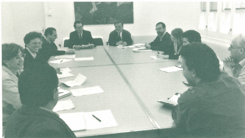
Direcció General i Directors dels centres.