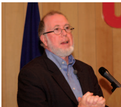
Kevin Kelly fundador de Wired

ra cada any i el nostre cos biològic no evoluciona a la mateixa velocitat. Hi ha una tensió, una fricció entre la ràpida transformació de l'esfera tecnològica i la lenta evolució biològica. La pregunta és: podrem mantenir el ritme? Jo crec que la ment és molt més adaptable que el cos, tot el que hem de fer és mantenir la ment adaptada, la nostra identitat, el nostre sentit del 'jo'. Penso que, si més no fins ara, la nostra ment és capaç de mantenir l'adaptació. Hem de veure què passarà en el futur, amb els nostres fills o amb nosaltres mateixos. En qualsevol cas, nosaltres ens hem adaptat d'una manera tan fàcil com ningú no hauria previst fa 10 anys. Crec que en el fons anem més ràpid del que ens pensem... Segurament tenim límits, però no descarto que tinguem sorpreses pel que fa a fins on podem arribar.