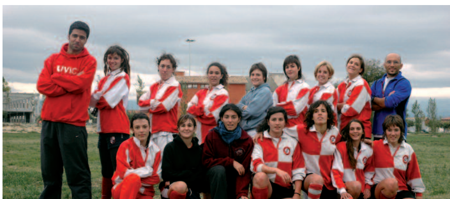
Equip femení de rugbi de la UVic.

La jornada va comptar amb la participació dels equips de la UdG, de la UPF i de la UVic. Després de celebrar els partits, molt disputats, l'equip de la Universitat de Girona va ser qui es va endur el campionat.