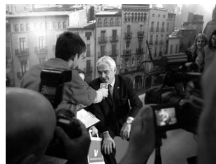
L'estudiant Didac Atzet entrevista Pasqual Maragall a l'estand de la UVic al Saló.

L'estand de la UVic del Saló de l'Ensenyament d'enguany, inaugurat el 9 de març, disposava d'una macrofotografia de la plaça Major de Vic que va ser-ne un dels atractius principals.