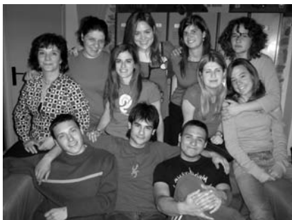
El grup actual de l'Aula de Teatre de la UVic