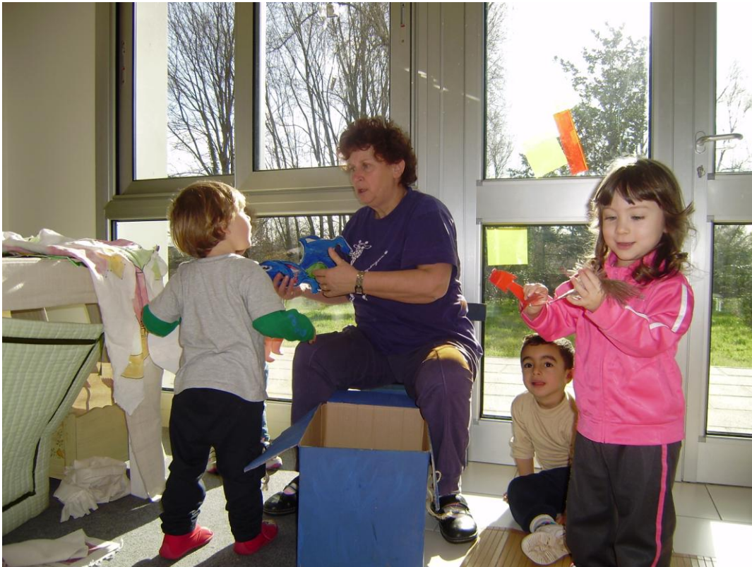
Nens i nenes mirant el llibre fet amb els records de les “capsetes de vacances” mentre la mestra els observa i anota el que diuen