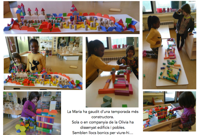
foto 6. Es tracta d'una nena que acostuma a centrar la seva activitat en el dibuix i l'escriptura. No sol participar en activitats de construcció. Dues anècdotes poden convertir-se en la imatge d'una nova faceta d'ella mateixa.

Parlàvem de la idea de que la documentació reflectís en la mesura del possible la realitat i la quotidianitat però ens vam adonar que a vegades ens pot interessar documentar fets anecdòtics i no representatius de la realitat: una petita fita, o l'acció d'un infant que creiem cal potenciar. Mostrar-li una nova imatge d'ell mateix pot ajudar un infant a alliberar-se de les etiquetes imposades (Faber, A. & Mazlish, E., 1997), ja que pot modificar la percepció que ells mateixos, els altres infants, docents o adults tenen (foto 6).