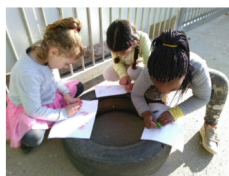
Caçadors de textures.

Els nens i les nenes han anat pel pati cercant diferents textures que han deixat marcadetes en un paper tot rascant amb una cera.