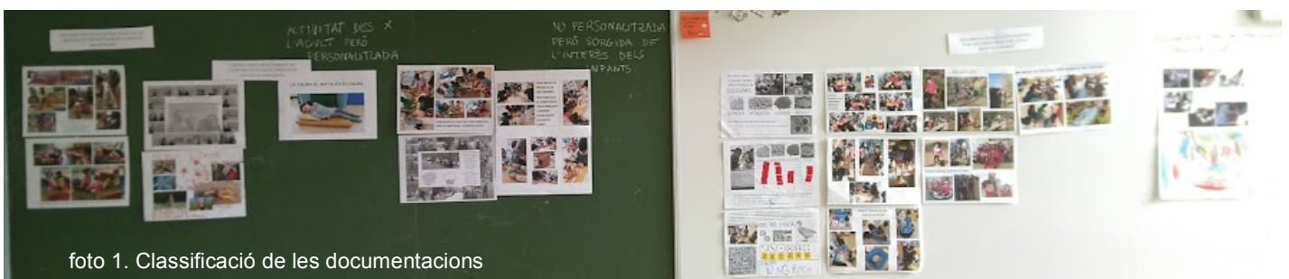
foto 1. Classificació de les documentacions

■ Gestió lliure del temps □ Activitats dirigides per l'adult