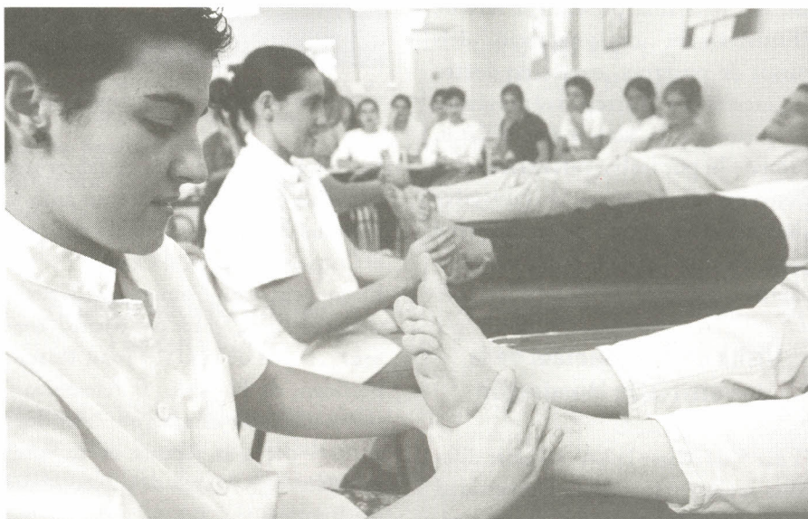
Alumnes d'Infermeria en una classe pràctica. L'Escola Universitària de Ciències de la Salut passa d'una a tres titulacions.

La Universitat de Vic impartirà el curs 1998-99 tres noves titulacions: Fisioteràpia, Teràpia Ocupacional i Biblioteconomia i Documentació. A hores d'ara continuen les negociacions pel que fa a les carreres de Turisme i Organització Industrial. Fisioteràpia i Teràpia Ocupacional queden englobades a l'Escola Universitària de Ciències de la Salut i Biblioteconomia i Documentació s'incorpora a la Facultat de Traducció i Interpretació, que canvia de nom i passa a dir-se Facultat de Ciències Humanes, Traducció i Documentació. La diplomatura de Fisioteràpia té com a objectiu formar tècnics en prevenció,