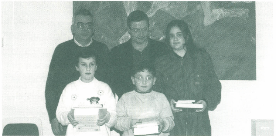
Els tres guanyadors del concurs «El meu primer llibre», amb els responsables d'Eumo Editorial.