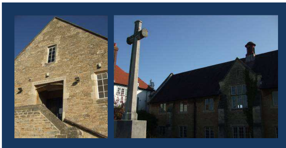
Summertown Church Hall, 9/04/2011

L'escola bressol Montessori de Summertown (Oxfordshire) ens pot servir aquí per visualitzar aquesta idea, no altrament, l'actual escola està instal·lada en l'edifici construït a partir de les peces de l'antiga església del poble que al 1920 foren traslladades a la seva nova ubicació, tot perdent la seva antiga funció però no representació, situació que ens du a copsar la importància que l'escola tenia i té encara per al poble –quelcom que podem extreure tant de l'emplaçament com de l'actual polivalència de l'espai– i, al mateix temps, a veure com estava en deute permanent amb l'església, ja fos com a dependència directa, ja fos a través de l'impacte que tenia en la comunitat.