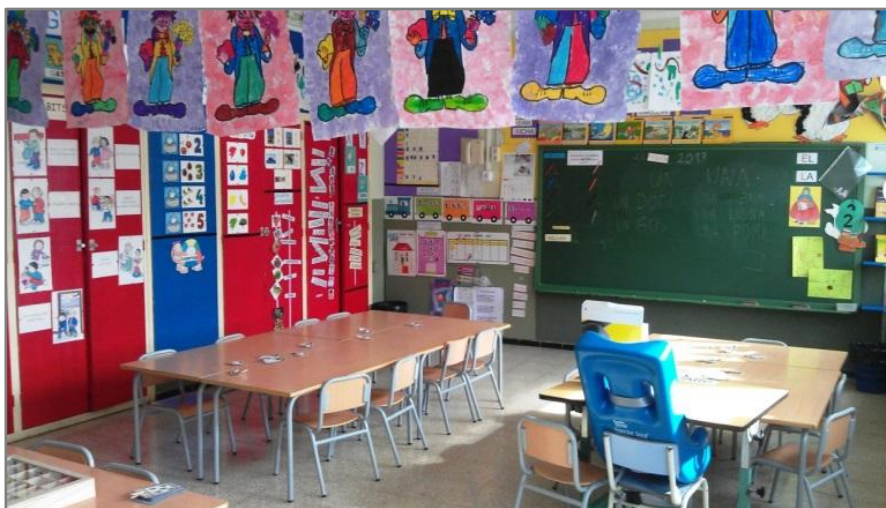
Figura 3. Aula de P4, Els Pingüins

És una aula dotada de molt material. Té molts armaris amb molt jocs didàctics, contes, etc. Hi ha estanteries amb llibres, mobles amb materials de plàstica i d'ús habitual a l'aula com per exemple, retoladors, tisores, cartolines, etc. També, compta amb un ordinador amb accés a internet del qual se'n fa un ús diari, per part de la mestra, per mostrar imatges o fotografies als infants sobre temes treballats, vídeos, escoltar música o bé són els propis nens i nenes que l'utilitzen per jugar o fer petits exercicis durant l'estona de joc lliure abans del pati.