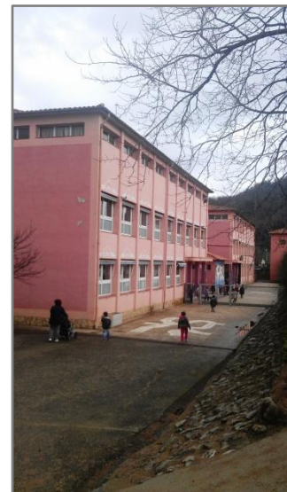
Figura 2. Façana posterior de l'escola Llar Lluís M re Mestras i Martí d'Olot