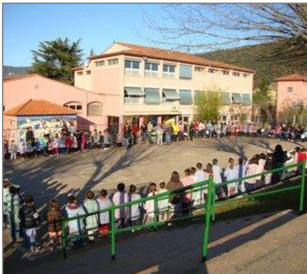
Figura 1. Escola Llar Lluís M re Mestras i Martí d'Olot

L'escola fou inaugurada al 27 de novembre de 1971. En un inici va ser construïda per atendre nens i nenes procedents de pobles de muntanyes de les rodalies. Més tard es va destinar a centre de tecnificació esportiva i després, va acollir als nens i nenes de pares i mares firaires que no tenien un lloc estable on viure. Durant aquest període l'alumnat no solament estava al centre durant la jornada escolar sinó, que també es quedava a dormir de dilluns a divendres. D'aquí ve el nom d'escola Llar. Finalment, el centre va deixar de tenir la funció de llar per ser un centre educatiu que acull nens i nenes des de P3 fins a 6è amb un horari escolar de 9 a 13h i de 15 a 16'30h.