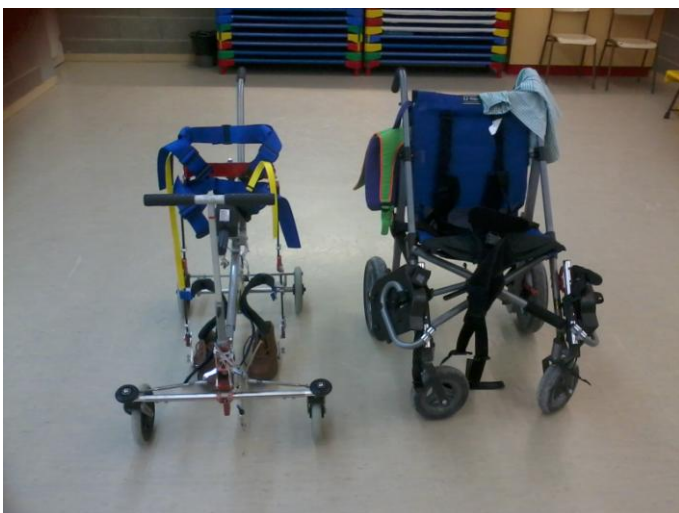
Caminador i Cadira d'en Pau