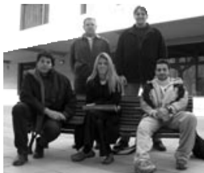
L'equip vencedor «Gescartera II».